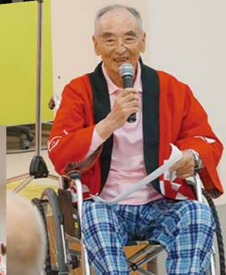
リハタン 夏祭り (^^)v