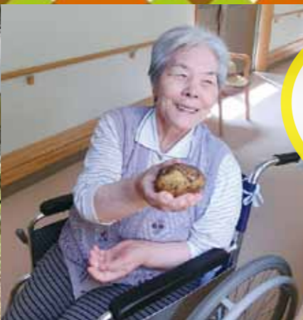
こんなのが 探れたよ♪