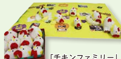
「チキンファミリー」 いちょう棟東・北ユニット