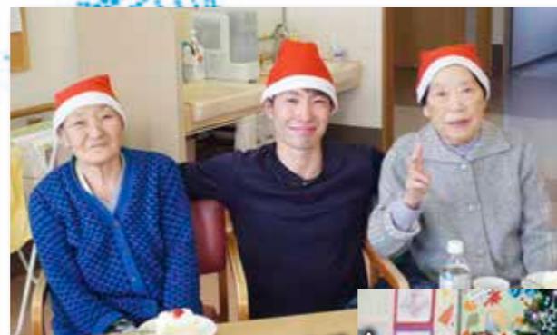
メリクリ! あけおめ!