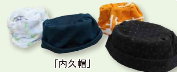
「内久帽」 つつじ棟西ユニット