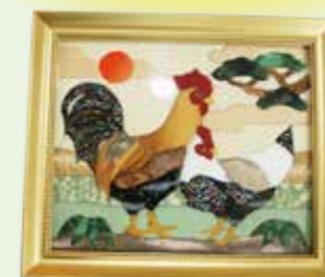
「おしどり夫婦」 澤里 エン