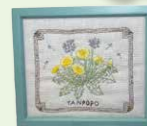
「たんぽぽ、ランプシェード他」 鹿糠 恵