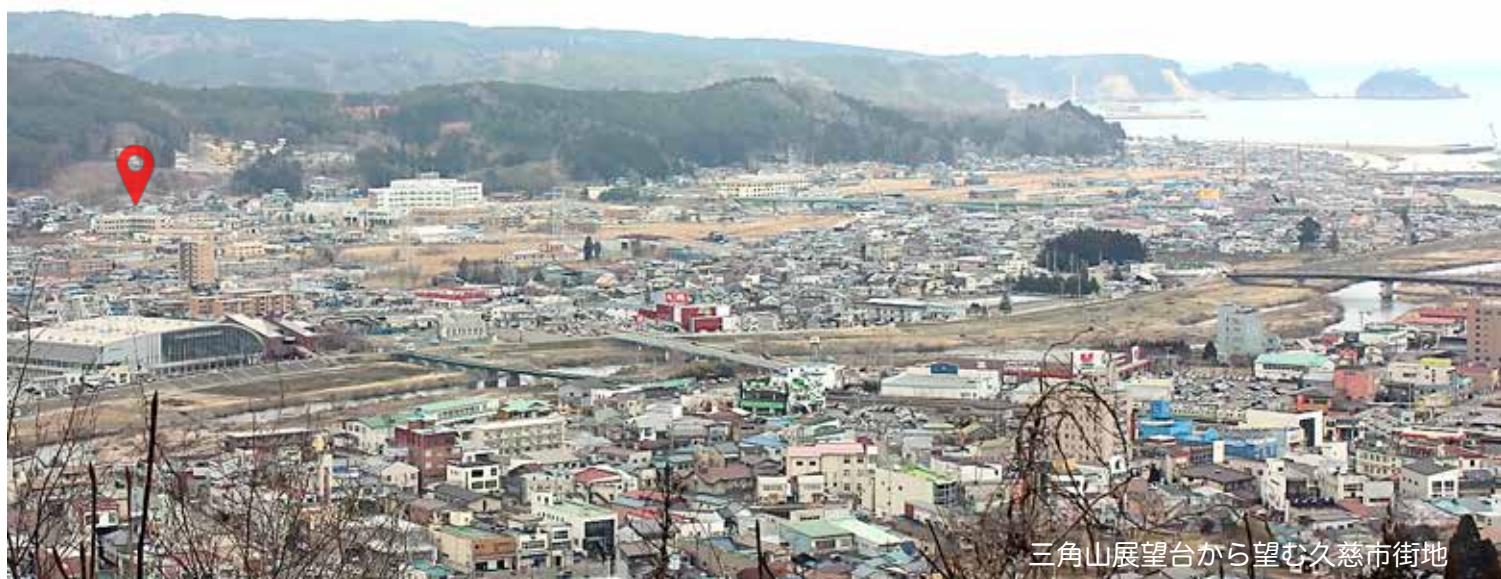
三角山展望台から望む久慈市街地

利用者と家族・地域の皆さん・職員が手を携えて歩みましょうとの思いを込めて名付けました。