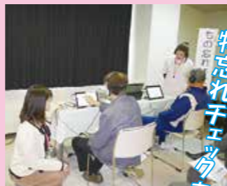
物忘れチェックあり!