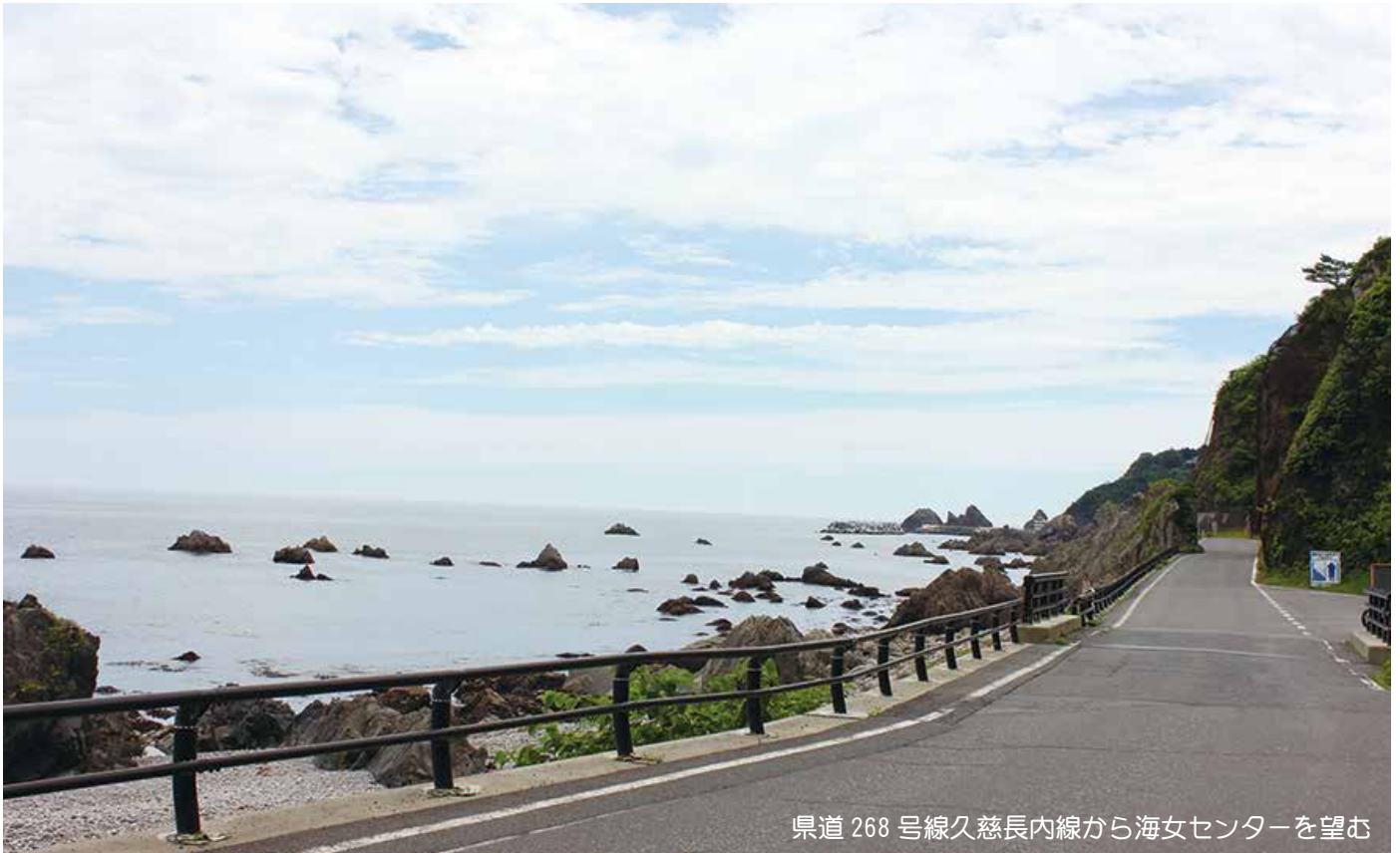
県道 268 号線久慈長内線から海女センターを望む

利用者と家族・地域の皆さん・職員が手を携えて歩みましょうとの想いを込めて名付けました。