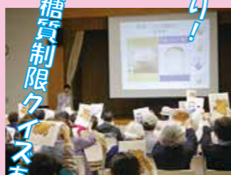
糖質制限クイズあり! 変則定