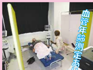
血管年齢測定あり!