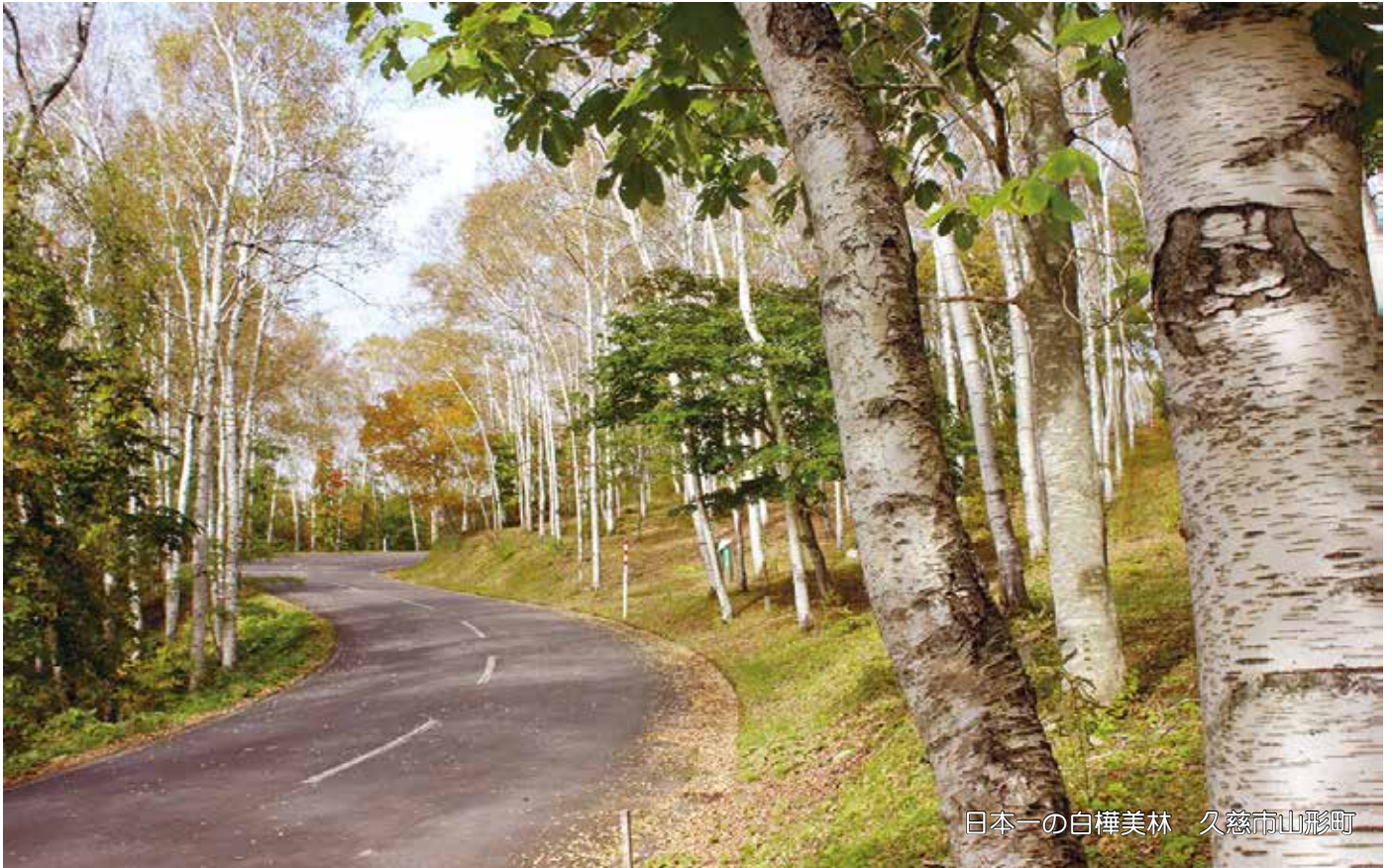
日本一の白樺美林 久慈市山形町

利用者と家族・地域の皆さん・職員が手を携えて歩みましょうとの思いを込めて名付けました。