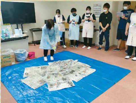
「ノロウイルス対策研修 嘔吐物処理」

長引くコロナ禍で施設内での研修も感染対策上制限があり、オンライン等での非対面での研修会参加を積極的に実施していました。施設内外での感染状況を注視しつつ、感染対策をとった上で、以前のような集合での研修も行われるようになってきています。良質で安全安心な医療・介護サービスを提供するためには日進月歩する知識や技術を常に学び続ける環境が必要です。今後もその学びを止めないように、新人もベテランも共に成長していけるように取り組んでいます。