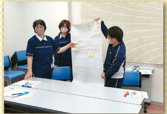
「新任者研修 グループワーク」