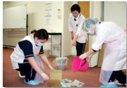
ノロウイルスを想定しての嘔吐物処理訓練の様子

私どもの委員会は主に施設内感染の予防と感染症発生時における適切な対応と拡大防止策を図るための活動をおこなっています。今年度は平成24年に設立された北いわて医療関連感染制御ネットワークの研修会に参加する等、積極的にレベルアップに努めています。