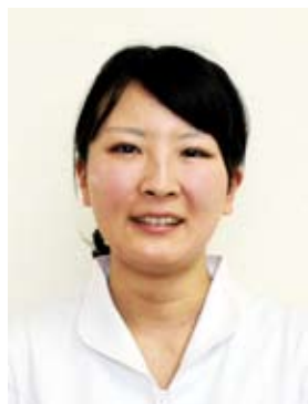
調理師（管理栄養士）